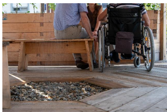
Figure 1 Modules de rafraîchissement du pavillon de haut en bas et de gauche à droite : végétalisation ; brumisation, douche et ombrage ; paroi de céramiques poreuses ; réception de l'eau de la douche

Plusieurs vagues de chaleur ont été observées à Lausanne durant l'été 2023. Ces vagues de chaleur ont permis de mettre en évidence l'efficacité du Pavillon, notamment grâce une réduction de la température ressentie de 5 à 10°C à l'intérieur du Pavillon (voir graphique ci-dessous, lundi 11.07).