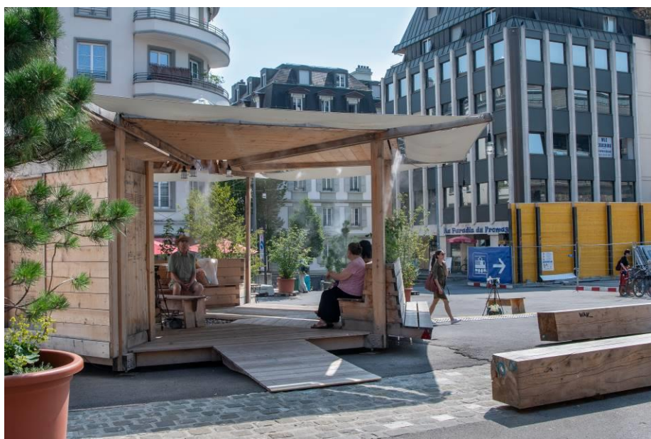
Figure 3 Vue nord du Pavillon, avec vue sur l'accès pour les personnes à mobilité réduite et les poussettes.

Nous en prenons bonne note et les transmettons également aux concepteurs. A noter qu'une rampe était en place pour les personnes à mobilité réduite, ainsi que pour les poussettes, comme on peut le voir sur la photo ci-dessous.