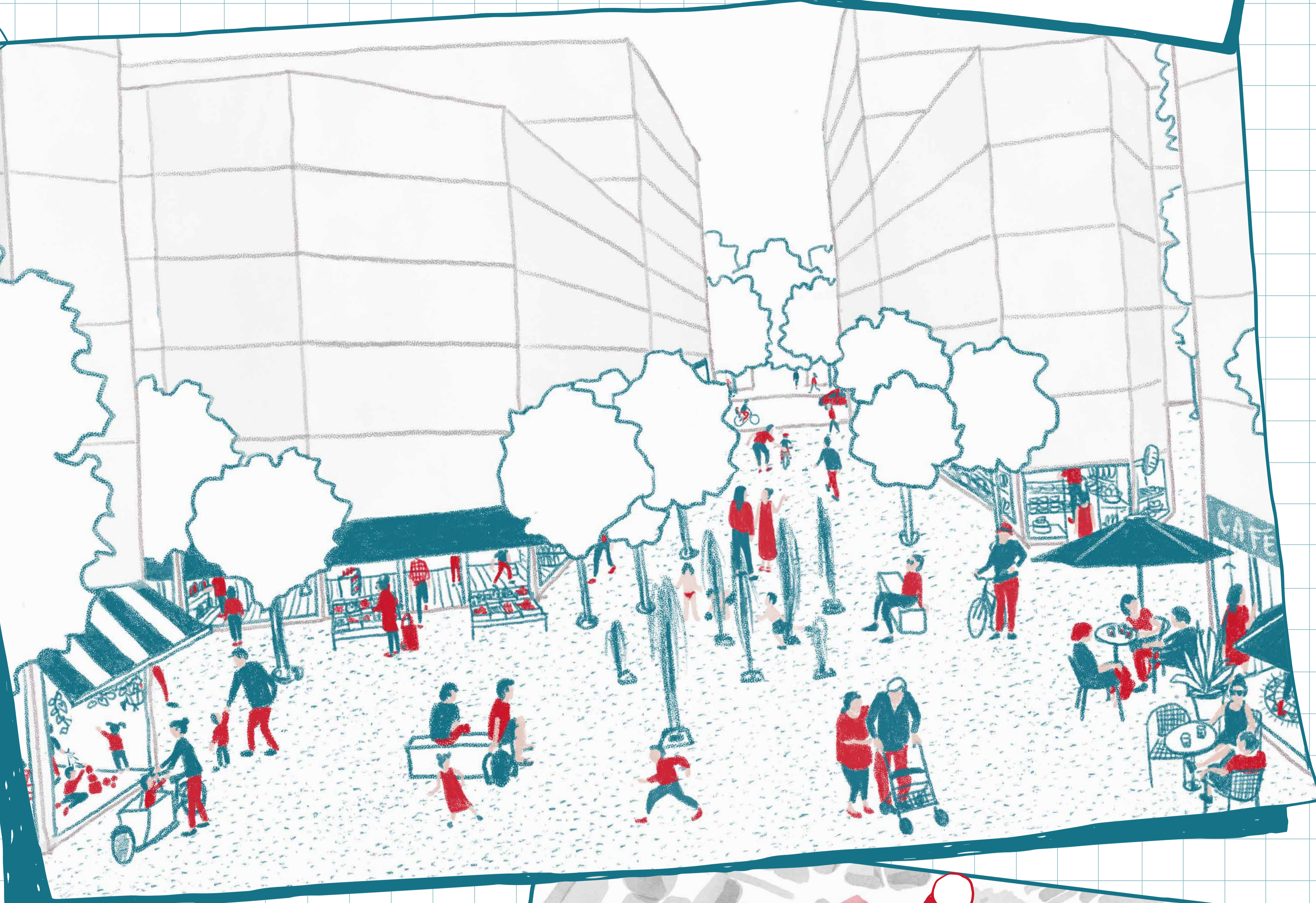
Ambiance imaginée par doraformica